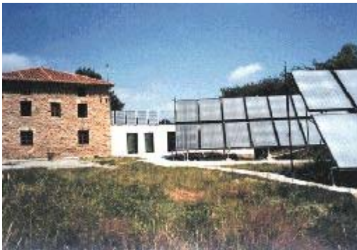
Instalación mixta autónoma de abastecimiento energético mediante paneles fotovoltaicos, colectores térmicos y aerogenerador.

Es la mayor fuente de energía disponible. El sol proporciona una energía de 1.34 kw/m 2 a la atmósfera superior. Un 25% de esta radiación no llega directamente a la tierra debido a la presencia de nubes, polvo, niebla y gases en el aire. A pesar de ello, disponiendo de captadores energéticos apropiados y con sólo el 4% de la superficie desértica del planeta captando esa energía, podría satisfacerse la demanda energética mundial, suponiendo un rendimiento de aquellos del 1%. Como dato comparativo con otra fuente energética importante, sólo tres días de sol en la tierra proporcionan tanta energía como la que puede producir la combustión de los bosques actuales y los combustibles fósiles originados por fotosíntesis vegetal (carbón, turba y petróleo). El problema más importante de la energía solar consiste en disponer de sistemas eficientes de aprovechamiento (captación o transformación).